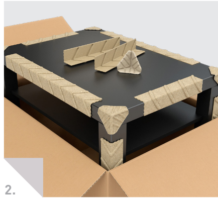
Möbelindustrie: Schutzecken für Tische.