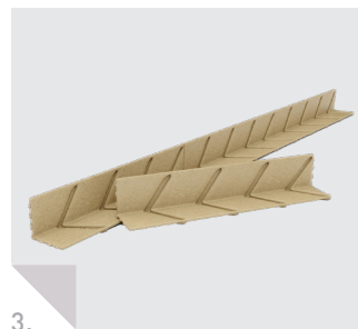
Kantenschutzzecke Basic Shock Block BEG