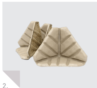
Kantenschutzzecke Soft Shock Block C