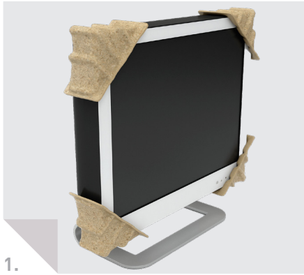
Elektroindustrie: Schutzecken für Monitore.