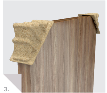
Möbelindustrie: Schutzecken für Schrankelemente.