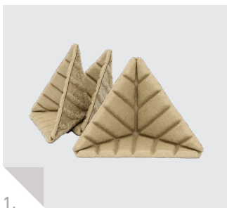
Kantenschutzzecke Basic Shock Block FC